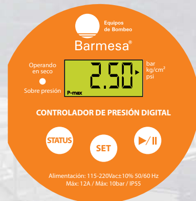
Carátula del presostato digital

El presostato se encuentra interconectado con la bomba, y además incluye 1.5 m de cable para conexión con clavija polarizada.