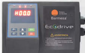
Variador de velocidad